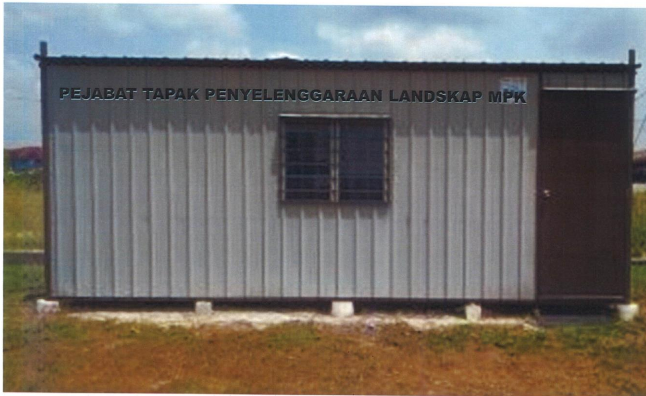
SPESIFIKASI PEJABAT TAPAK KONTRAKTOR LANDSKAP MAJLIS PERBANDARAN KLANG